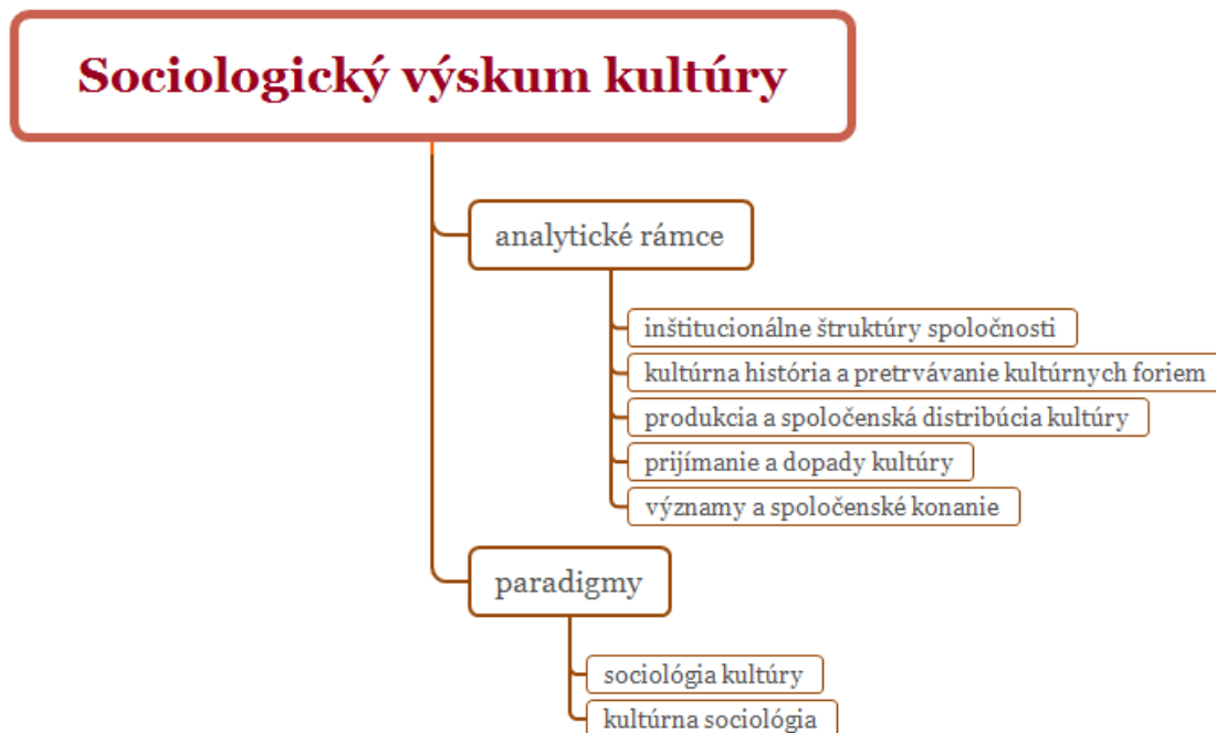
Obr. 3. Sociologický výskum kultúry

Cieľom sociologického skúmania kultúry je z nášho pohľadu poskytovať údaje na analýzu z paradigmatických prístupov sociológie kultúry (videnie kultúry ako závislej premennej, sústredenie sa napríklad na otázky vysokej a nízkej kultúry, vzťahu medzi vzdelaním a kultúrou, vzťahu ku kultúre na základe vzťahu k iným spoločenským otázkam, atď.), ako aj z oblasti kultúrnej sociológie (videnie kultúry ako nezávislej premennej, ktorá podmieňuje ľudské konanie, napr. kultúrna pamäť, interpretácia kultúry).