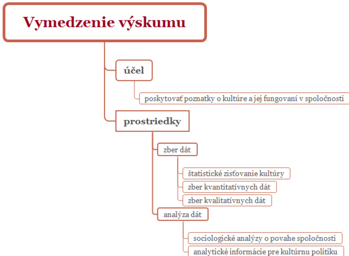
Obr. 2. Vymedzenie výskumu

Analýza dát o kultúre pracuje s údajmi pochádzajúcimi zo sociologických výskumov, ako aj s údajmi, ktoré boli zozbierané prostredníctvom štatistického zisťovania. Analýza dát prebieha v závislosti od paradigmatického náhľadu na dané údaje – môže teda ísť o sociologickú analýzu, analýzu ekonomiky, či analýzu kultúrnej politiky.